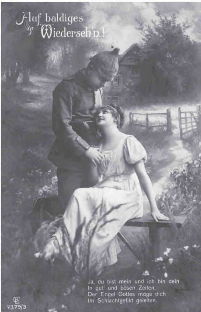
□ Лицевая и оборотная сторона открытки Густава Люттвица.

Открытка была адресована госпоже Берте Цинер, проживавшей в Берлине на улице Инвалиденштрассе, 148 (современный центральный район Берлина Моабит).