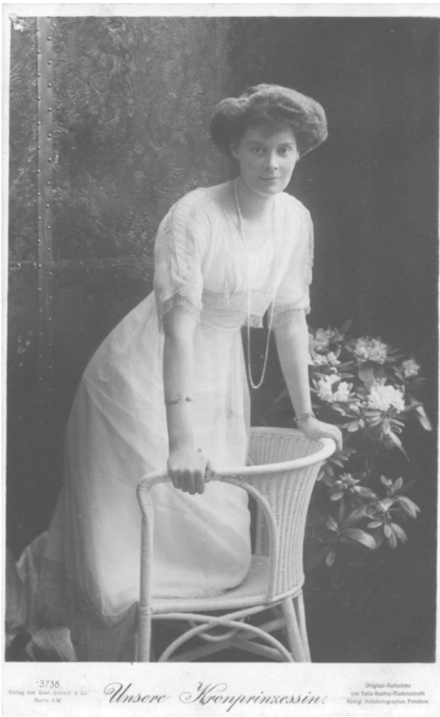
□ Открытка с изображением кронпринцессы Цецилии Мекленбург–Шверинской, 1910–ые годы.

газобаллонная атака немецких позиций. В боях под Сморгонью принимали участие: будущий маршал Советского Союза и министр обороны СССР Родион Малиновский, писатели Валентин Катаев, Михаил Зощенко и Константин Паустовский и многие другие известные в будущем россияне. Возможно, что кого-то из них через пулеметный прицел видел отправитель открытки фельдфебель Густав Люттвитц, которому судя по тому, что он служил в ландвере – войсковых формированиях 2-й очереди, создаваемых после объявления всеобщей мобилизации из запасных, ранее отслуживших военную службу – было на тот момент, как минимум, под тридцать лет, и он, наверняка, как большинство его однополчан носил усы а-ля кайзер Вильгельм II.