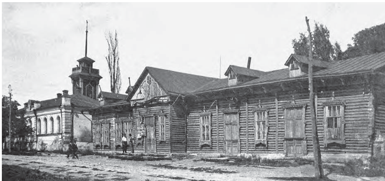
□ Кинотеатр Е.И. Яковлева на Краснослободской улице. Фото 1910–х гг.

Крестьяне, приезжавшие на базар из далеких волостей, часто бывали одеты в солдатские шинели и серые мерлушковые папахи. У одних пристегнут пустой рукав, у других - костыли и самодельные деревянные кисти. Изуродованные, отравленные газами они приезжали в родные края и ужасались разорению своего хозяйства, бедности в доме и никто уже не удивлялся этому повальному крестьянскому горю.