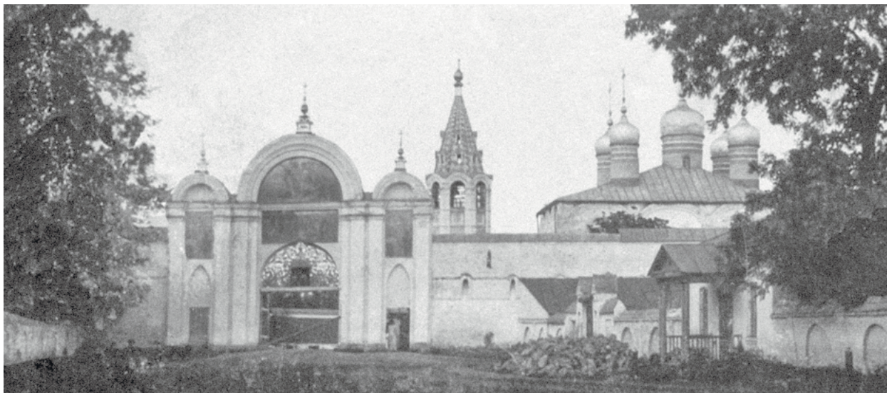
□ Свято-Троицкий монастырь в Лебедяни. Фото 1910-х гг.